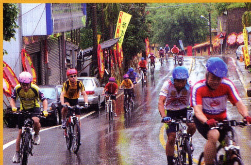
▲雨中進行的第一屆縣長盃勇闖136縣道比賽。

台中縣太平市為了推廣自行車的騎乘與市鎮觀光，也曾於今年5月推出第一屆『2006台中縣長盃136縣道自行車挑戰賽』該路線從一江橋至赤崁頂全程15公里，海拔落差599公尺，136縣道平時就是車友們自我魔鬼訓練的路徑，整條路線直通南投縣的日月潭，但是136縣道目前尚未規劃有自行車道，車友平時在自我騎乘訓練時，須注意來車，畢竟安全才是王道。