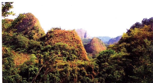
▲小桂林山區可見到礫石山壁的景致。

過了台中寶山紀念公園進入俗稱小桂林的山區，沿途順著彎曲的溪流依山前進，欣賞奇山美景，優美的景致，宛如來到另一個世界。自行車道的終點就是柏油路面的終點—清水坑溪，路旁放置兩座大貯水槽，儲存由山頂引進的山泉水，據說水質非常甜美，附近的居民經常開著車前來載水回去泡茶。