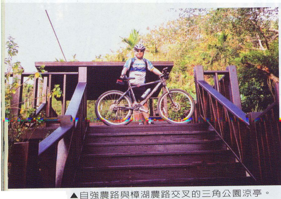
▲自強農路與樟湖農路交叉的三角公園涼亭。

◎路線：一江橋長龍路／H122M—6.5km—茅埔產業道路／H215M—8.8km—仙女產業道路／H278M—12.84km—樟湖農路／H515M—14.72km—月光森林休閒區／H710M—17.29km—自強農路三角公園／H510M—19.72km—茅埔產業道路／H290M—20.26km—茅埔、仙女產道叉路／H278M—22.56km—長龍路136縣道／H215M—29.10km—一江橋／H227M