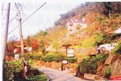
▲酒桶山，已有多家休閒餐飲店進駐。

過長興橋後到達東汴國小，旁有一叉路，分別是仙女產業道路和茅埔產業道路，兩條道路皆可通往月光森林休閒區，根據路況和景致考量，建議