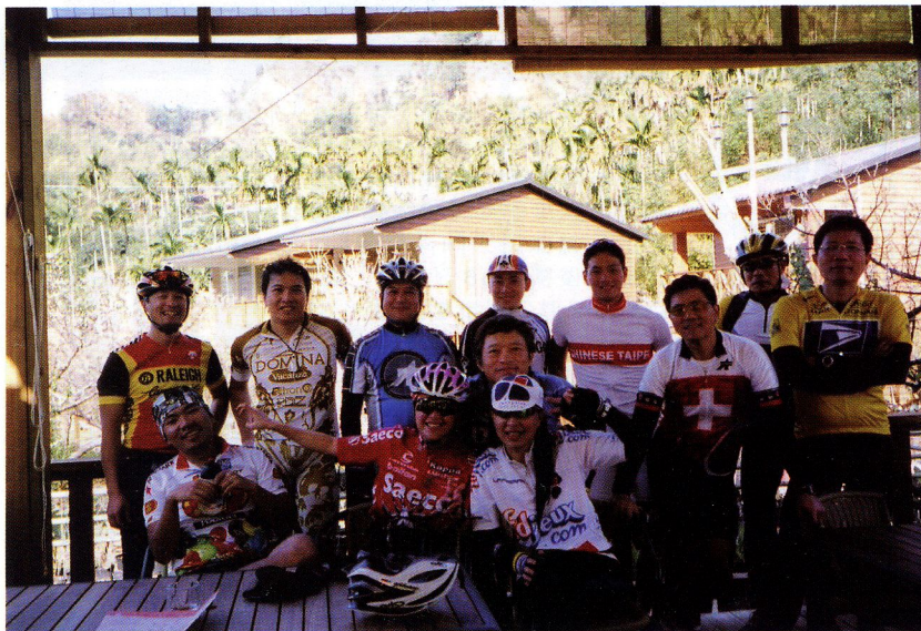
▲鐵馬賽克車隊攝於梅林親水岸。

◎路線：一江橋／H122M－1.74km－北田路自行車道（中99鄉道）／H143M－11.46km－梅林親水岸／H355M－15.21km－營區最高點／H630M－20.48km－中興嶺／H480M－28.8km－台中大坑圓環／H173M