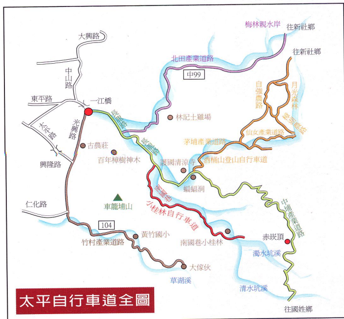
太平自行車道全圖

有多條太平自行車道以一江橋為匯集地，從一江橋出發後，有適合逍遙遊的輕鬆路線，也有極富挑戰性的艱辛路線。在此提供5條自行車道以饗車友，內容詳細記錄車道海拔高度、距離、路況困難度等供車友參考。