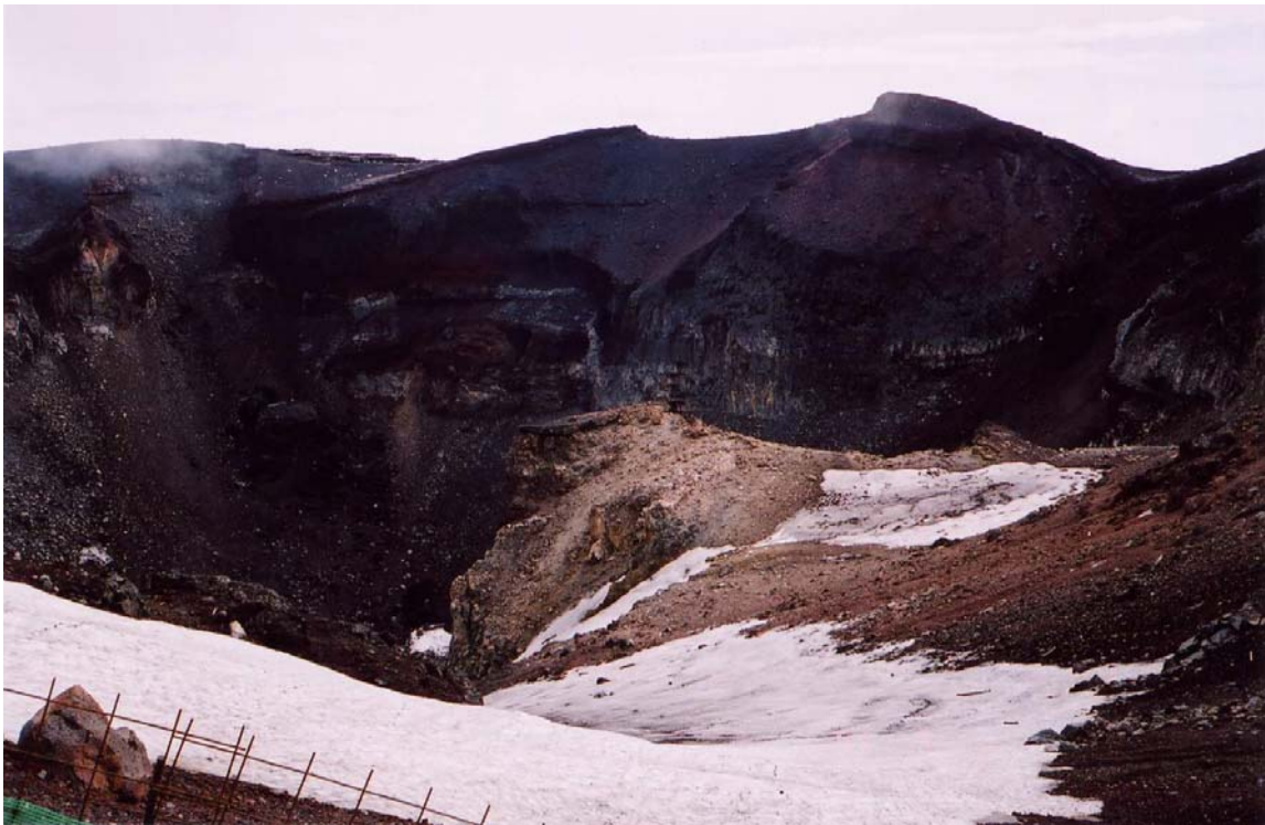
～ 富士山火山口尚有厚厚的積雪 ～

*08：30 富士山最高峰劍峰 H3776M，立足於日本第一高峰，隊友們興高采烈的歡呼，慶祝經過強風、濃霧侵襲還是堅持到底，終於到達了劍峰，達到遠渡重洋的心願登上日本第一高峰”富士山劍峰”。此時上天為了鼓勵隊友們的勇氣，竟然在山頂上有 15 分鐘呈現好天氣，不只雲消霧散，連火山口裡也是清晰可見，一覽無遺的呈現在隊友們的眼裡，火山口裡面尚有多處殘留厚厚的積雪。感謝上天的厚愛，多次的賜福，讓我遠渡重洋而來不虛此行。