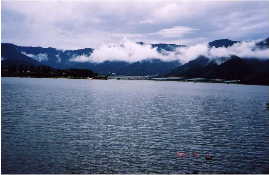
～ 富士山河口湖 ～

隊友王招貴號稱曾是三鐵的運動員，卻因高山症無法登上富士山，富士山已屬易登的高山，竟然無力攀登。所以山友在要從事高山活動時，必須先到高山上適應高山生活看是否有高山症，台灣的合歡山是蠻適合山友初登的百岳高山，王山友雖然沒有登頂成功，但已到達標高 H3500 公尺處是他攀登過最高海拔處，已屬難能可貴，事後王山友豪氣萬千的說”I will come back.”。