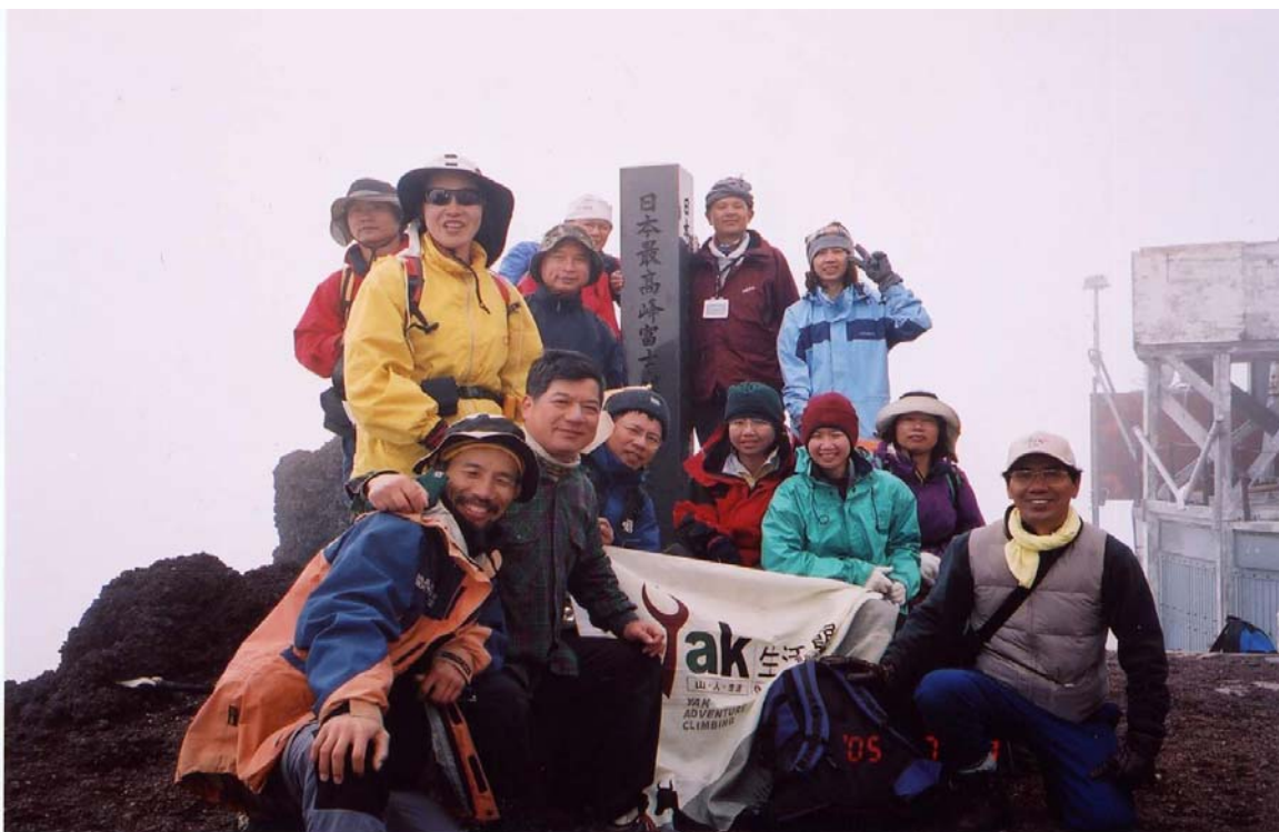
～ 隊員合照於日本富士山 最高峰”劍峰” ～