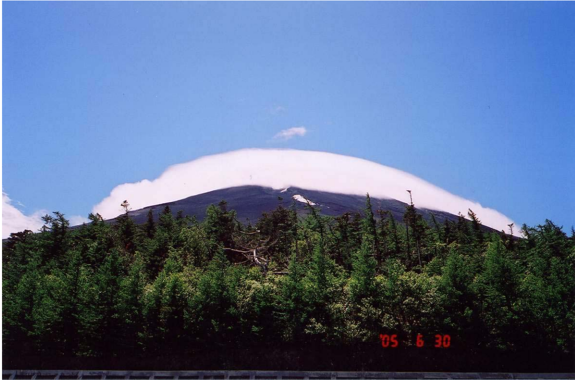
～ 日本富士山 ～

*12：45 六合目 H2390M，雲霧已稍微展開，可拍攝山中湖和河口湖的高山湖泊美景。