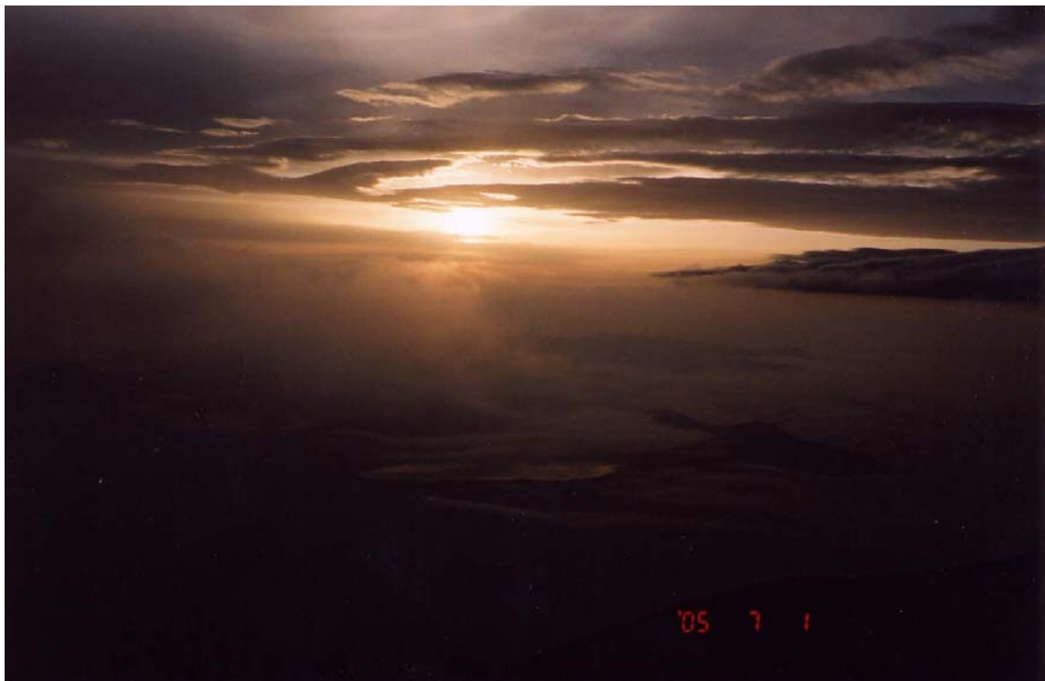
~ 富士山本八合目攝日出 ~

*05:10 本八合目 H3400M, 天氣已變壞, 濃霧籠罩整個山頭, 太陽也已不再露臉。