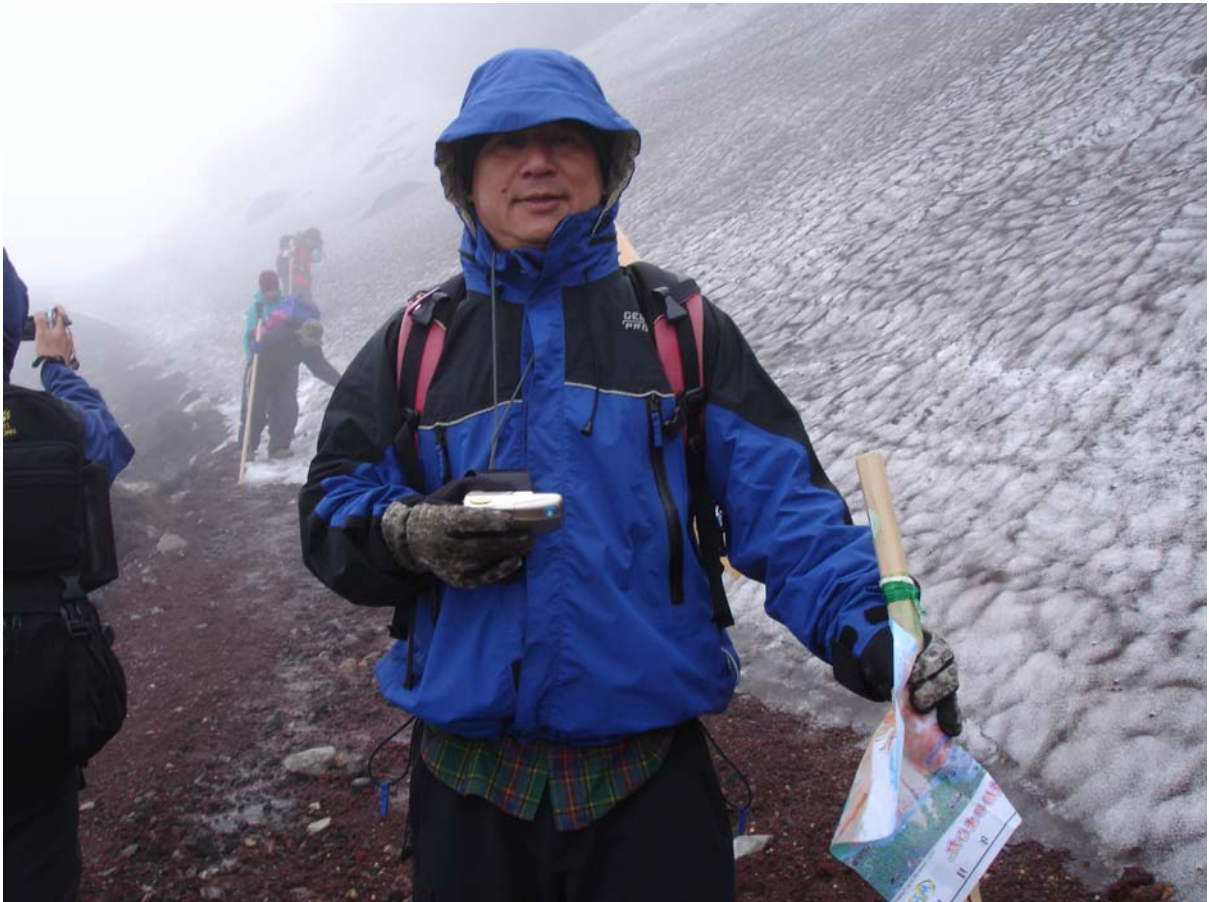
～林錫勳攝於尚有厚厚積雪的富士山火山口 江國華攝～

直線下切 700 多公尺只花了 40 分鐘，可知坡度之陡，還有速度之快更不是人為可以控制，只好隨著砂石往下滑，反而可以減少膝蓋硬撐之苦。如需從此下山道上切至富士山困難度蠻高的，走二步將退一步，難怪沒有登山客從此登山步道上升至富士山。