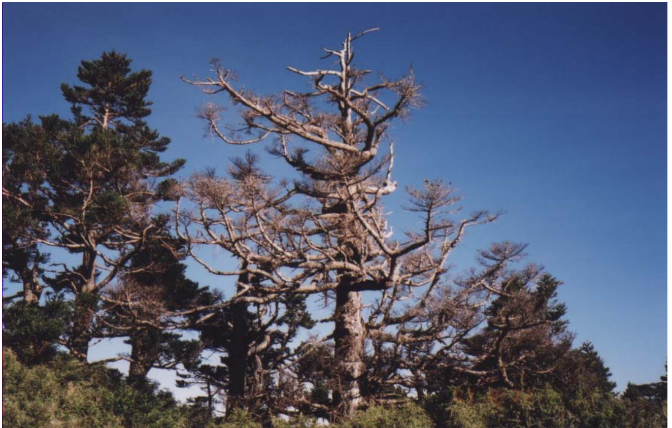
～ 途中美景 ～