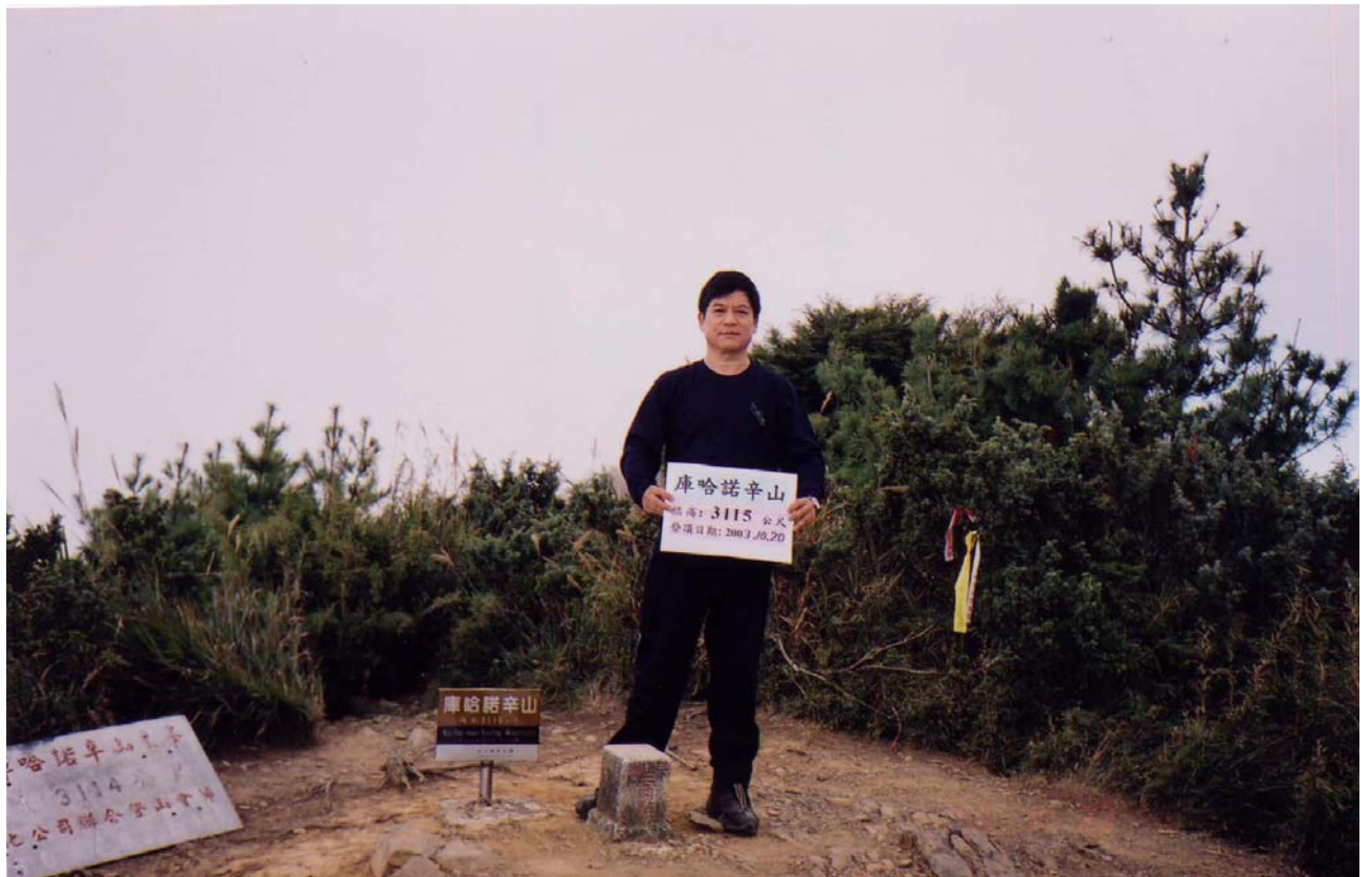
～ 林錫勳攝於庫哈諾辛山 ～