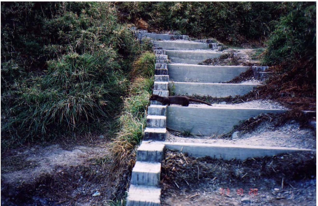
～ 3026 山屋步道巧遇黃鼠狼 ～