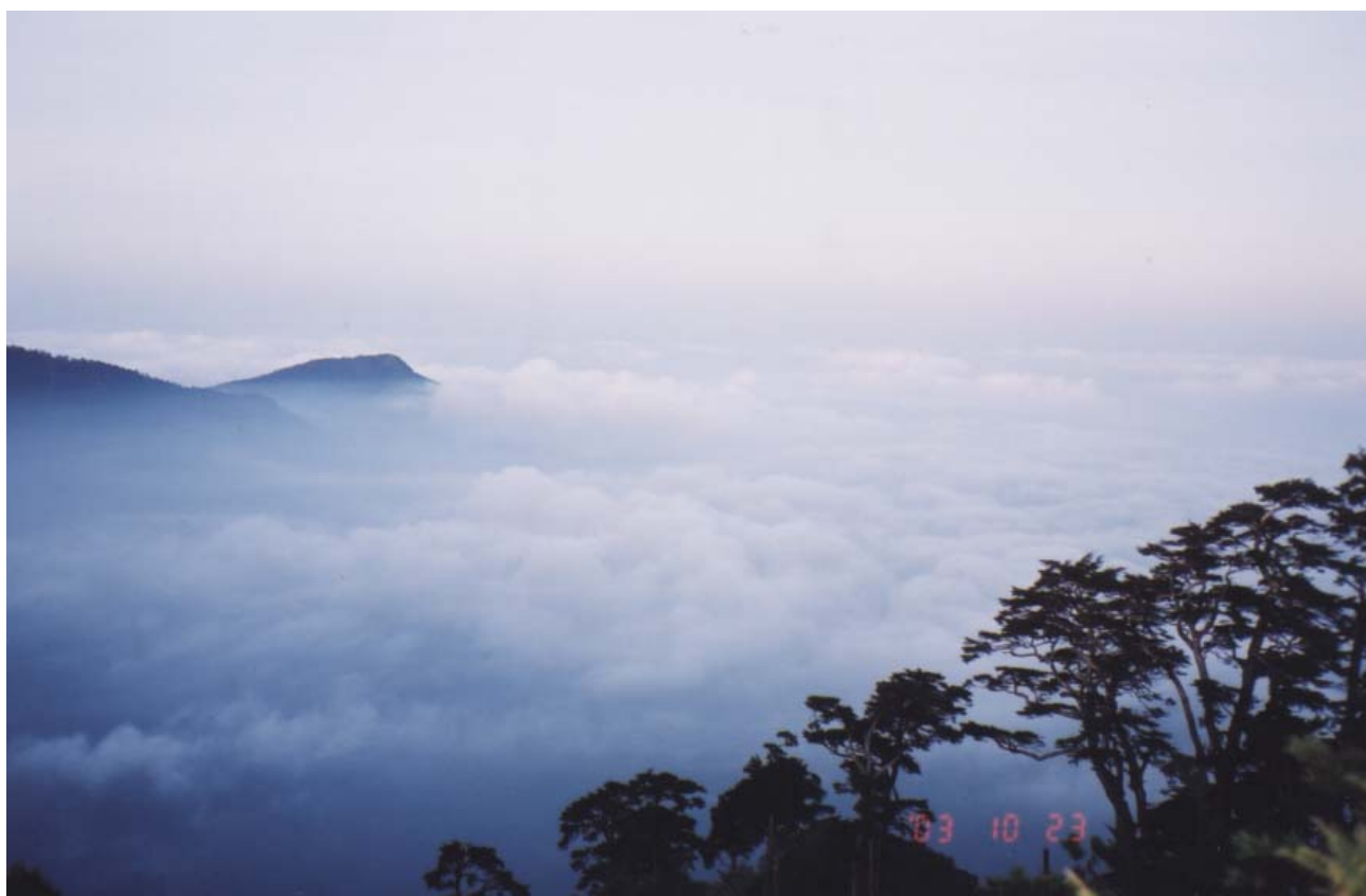
～ 馬西巴秀山前—西面雲海 ～