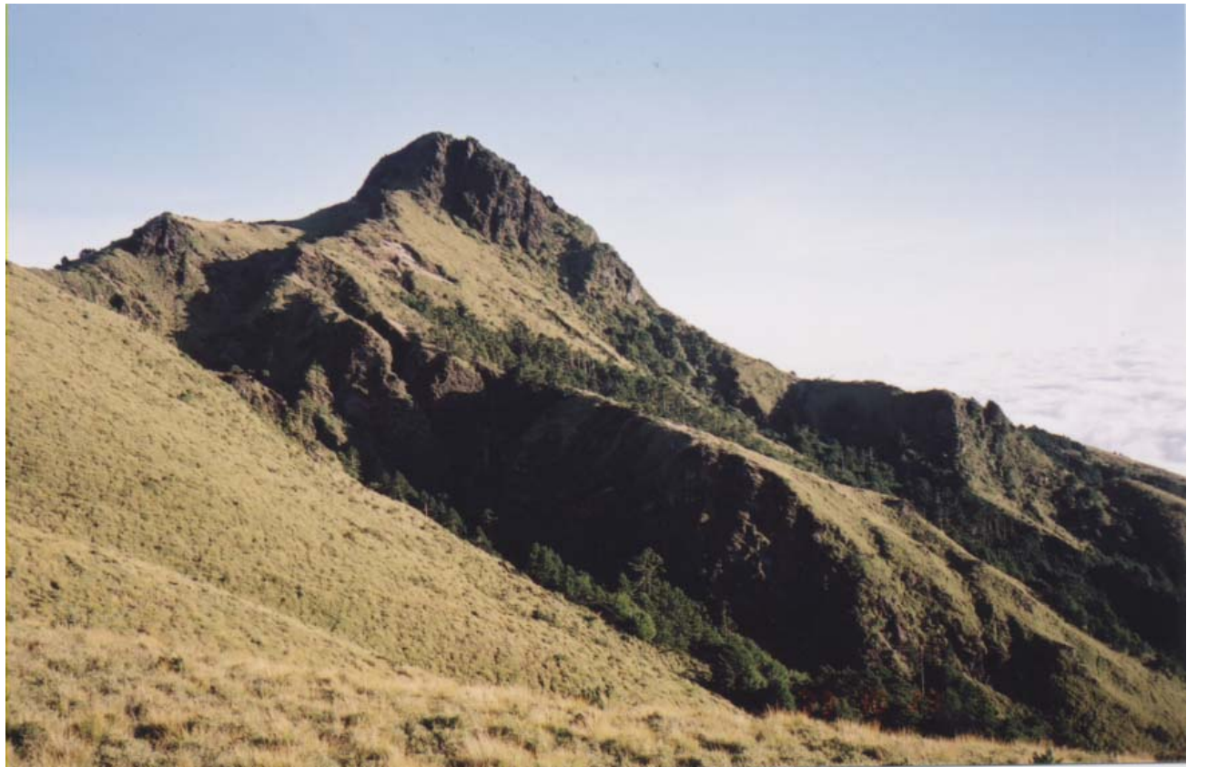
～ 卑南主山 ～