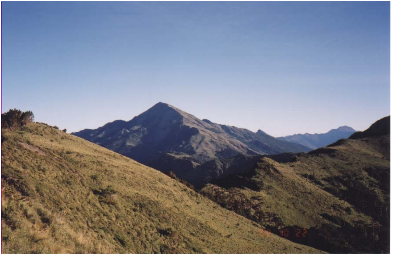
～ 往小關山途中回攝關山 ～