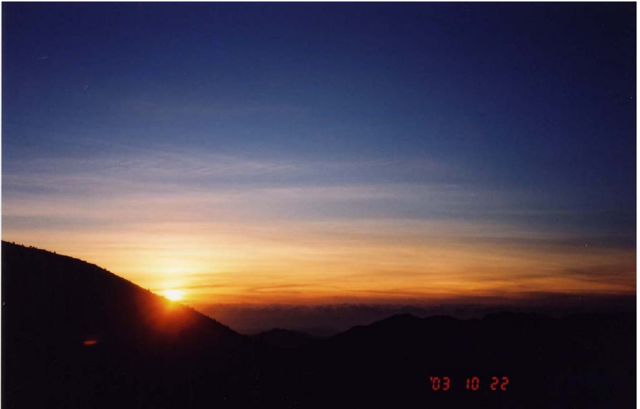
～ 日出，攝於海諾南山南鞍 ～