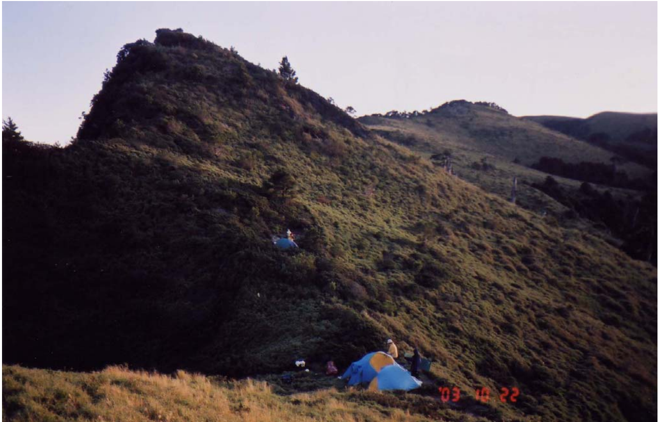
～ 海諾南山南鞍營地 ～