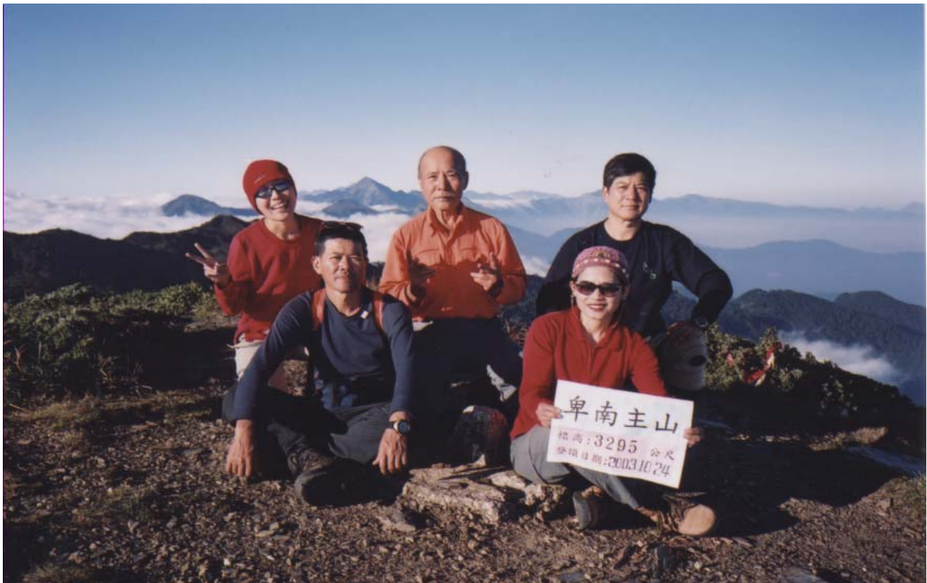
～ 哇哈登山隊合照於卑南主山 ～