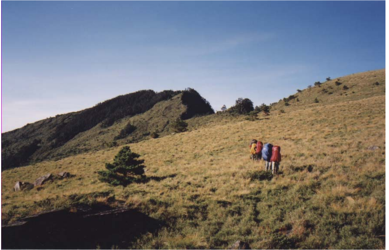
～ 往小關山途中 ～