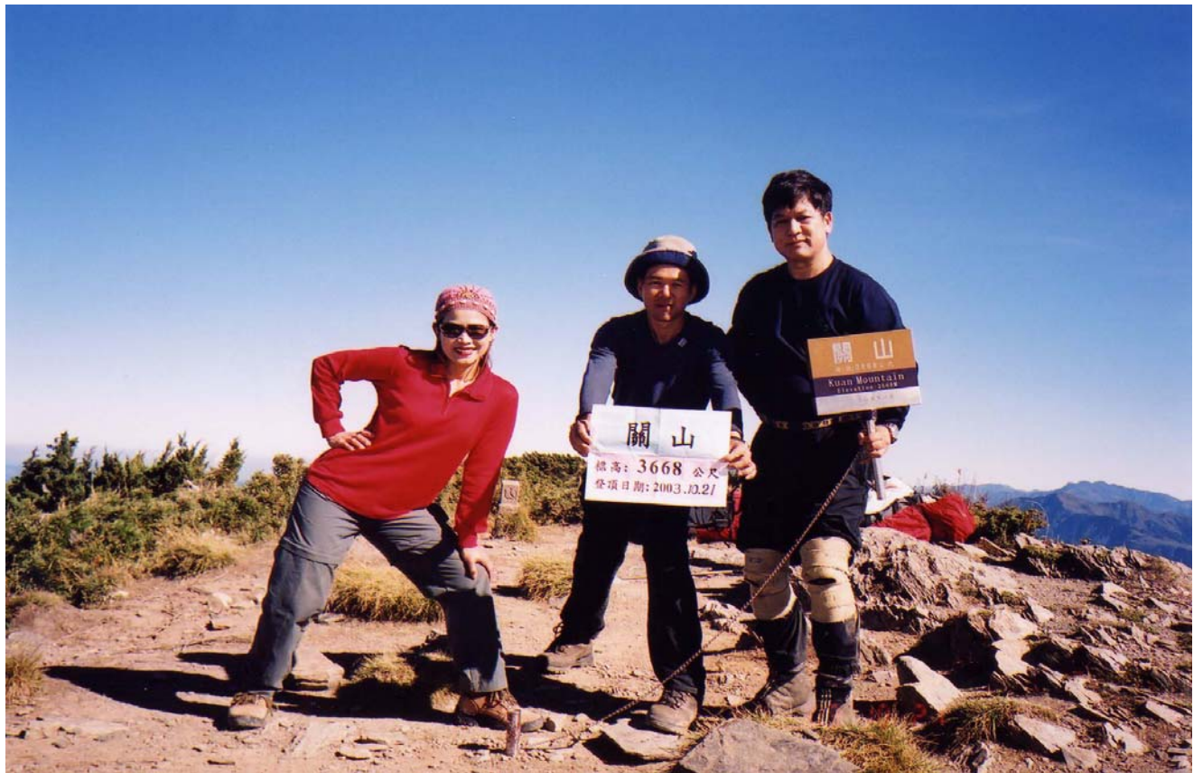
～ 攝於關山頂 ～