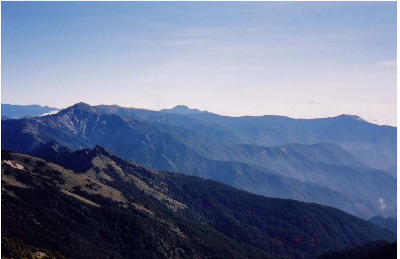
～ 向陽大崩壁 ～

- 在關山用午餐和休息，當然免不了又是登山者的奢侈享受“午睡”。不過山頂上沒有大樹可遮陰，太陽太大直曬不易睡著，下次記得像領隊一樣帶支小雨傘，雨天可遮雨，午睡又可遮陽，女性山友方便時又可遮人。