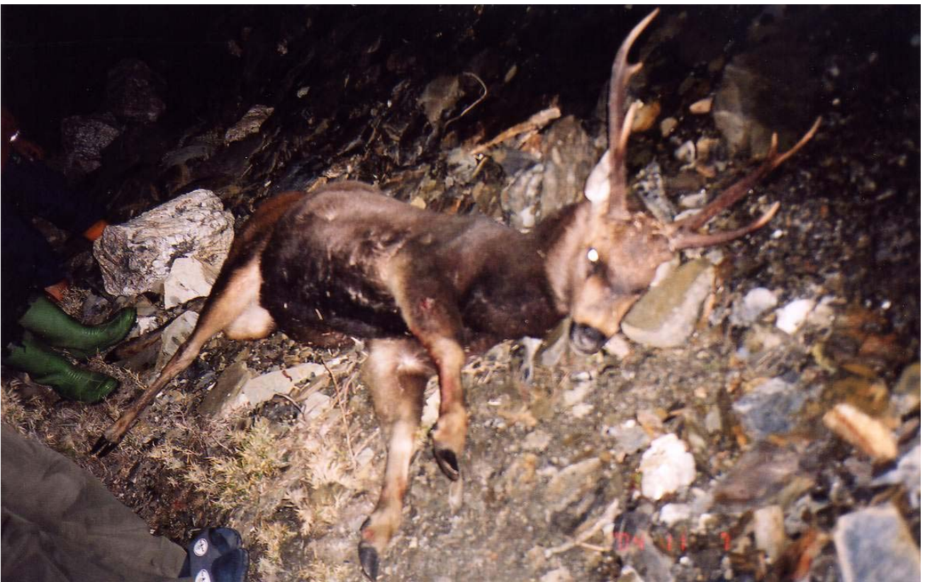
～ 丹大溪源頭水鹿 ～

回帳棚時換阿清要去聽流水聲，心想糟了，獵人出巡，水鹿恐怕凶多吉少，還好沒多久阿清就回來了，問其到外面做什麼，原來也只是去尿尿，並沒有危及水鹿的安全。水鹿因缺乏鹽分，需要鹽分，所以會在人類尿尿的地方，舔尿吸取其鹽分。