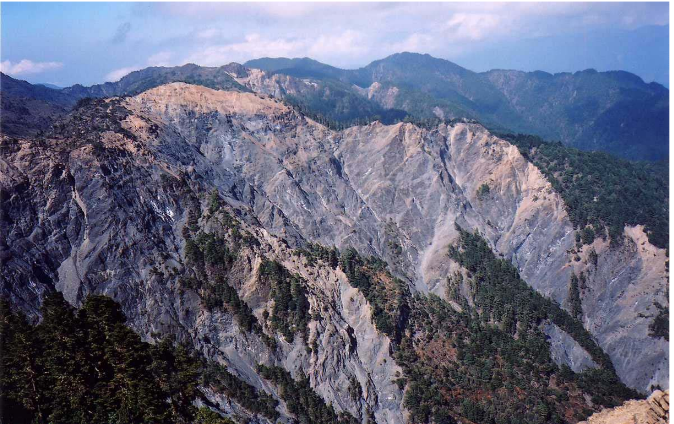
～ 東郡大山崩壁 ～

*17：10 東郡大山 H3619M，至東郡大山時已起霧，天色漸暗，後至的隊友待明天才到山頂補照登頂像。