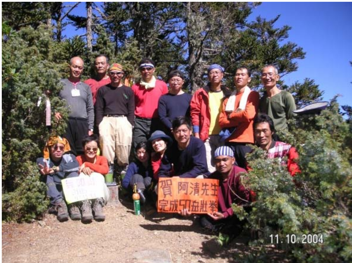
～ 無雙山基點峰合照 ～