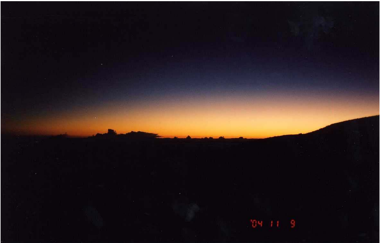
～ 烏達佩山攝日出 ～

※C9 郡大林道 42K 工寮營地：工寮已破舊不堪，勉強可擠進10人，但髒亂必須稍加整理和鋪帳棚方可夜宿。外面林道約可搭4人*3T。水源就在42K後方約5-10分鐘處有塑膠管出水口可取水。