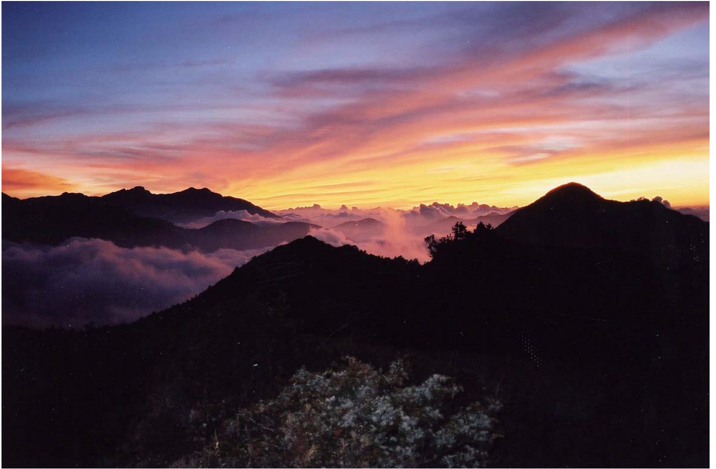
～ 裡門山的晚霞 ～