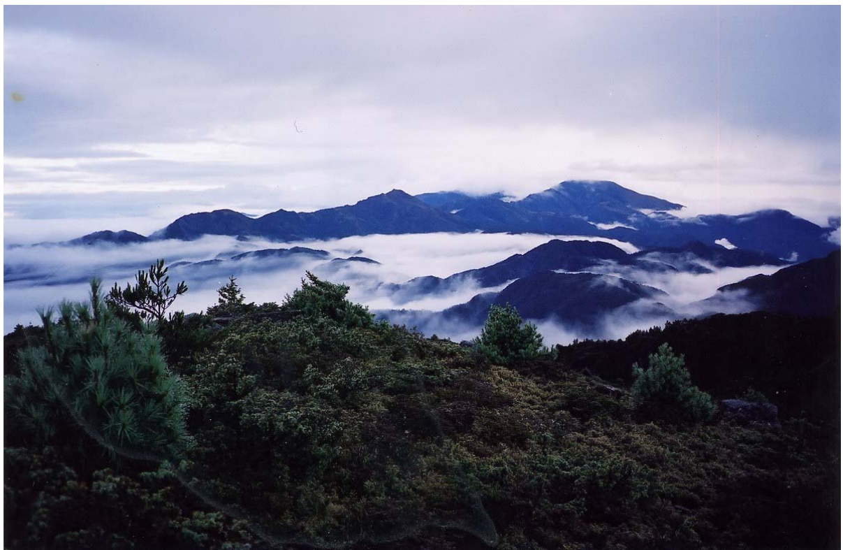
~ 內嶺爾山的雲海 ~